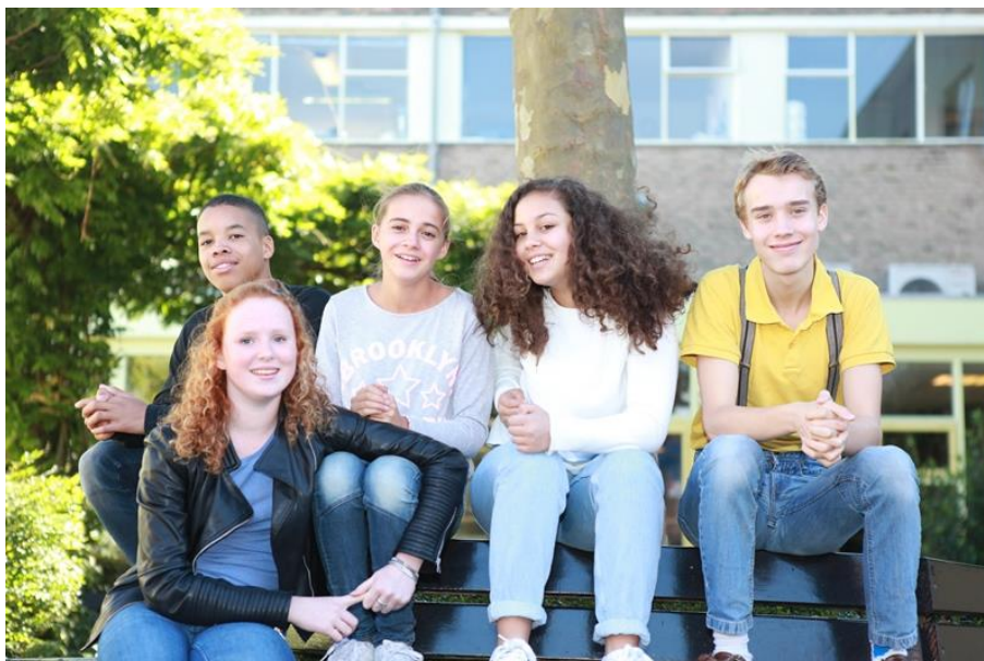
'Met ieders talent werken aan de toekomst'.