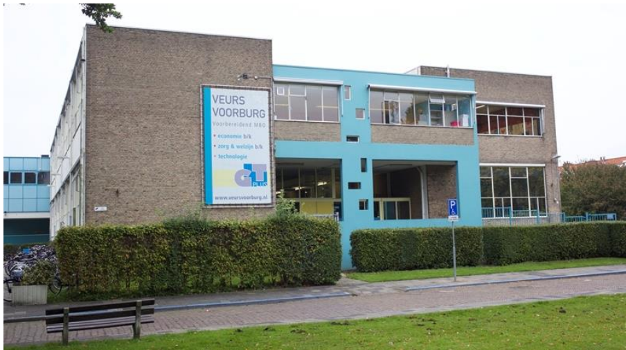
De school is al langere tijd met de gemeente in overleg over nieuwbouw.

Een ander schoolgebouw zou, ook in dit geval, zeker bijdragen tot de aantrekkingskracht/aantrekkelijkheid van de school.